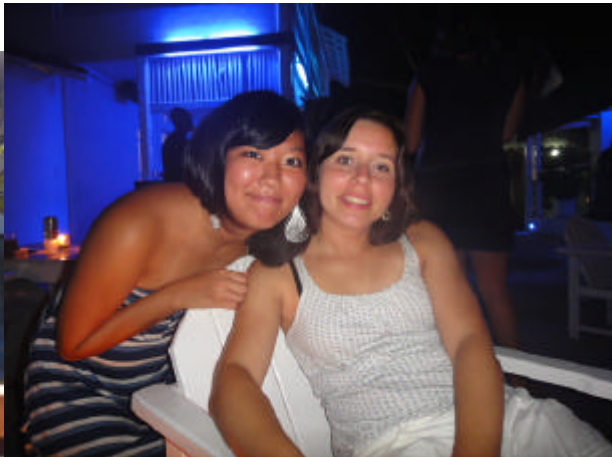
昼夜ダンスパーティー、海