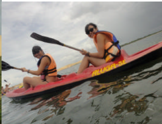
バギーで砂漠探検、湖でカヌー、ホフォというダンスの授業