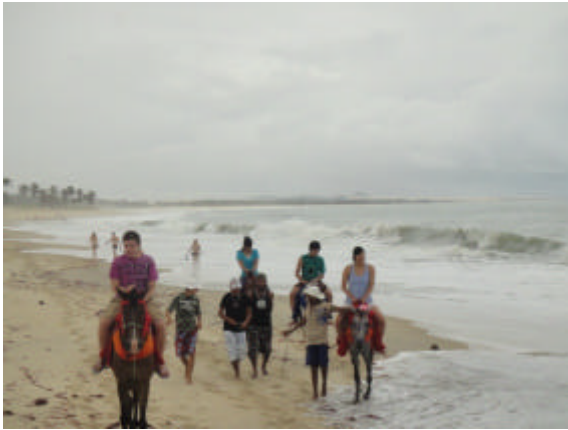
あいにくの雨によりホテル前のビーチで乗馬